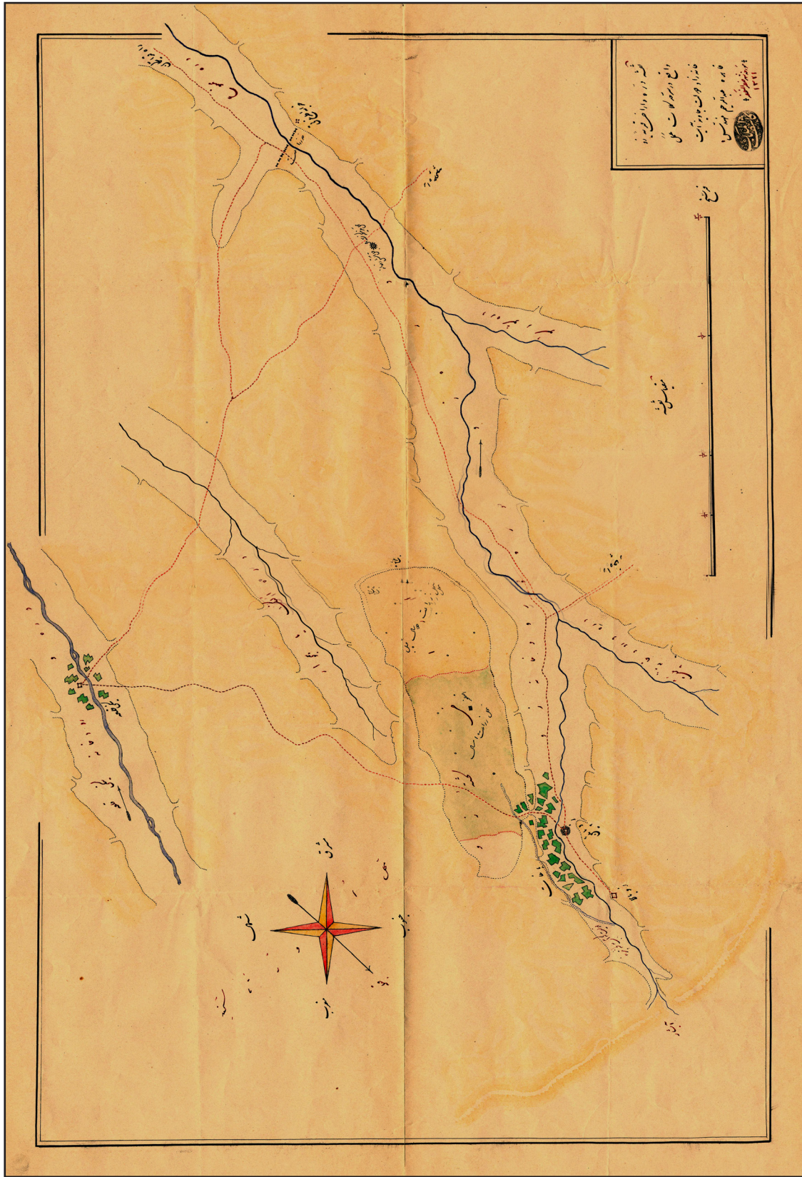
تصویر ۷. نقشه دره و اراضی قریه زو واقع در سرحد کلات.