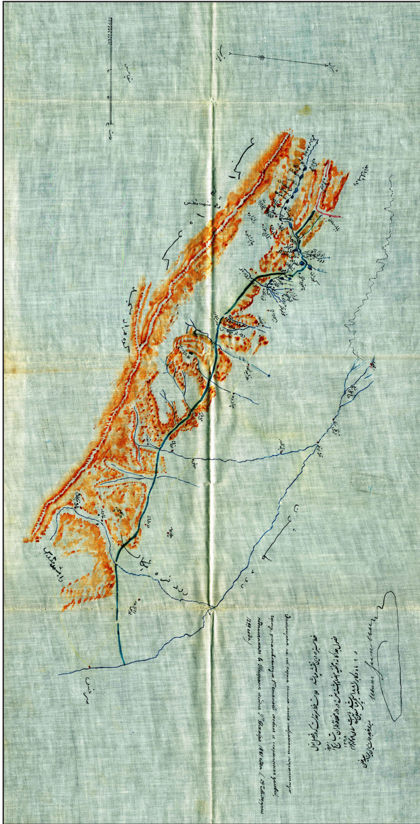
تصویر ۵. نقشه کروکی کلات در شمال خراسان.